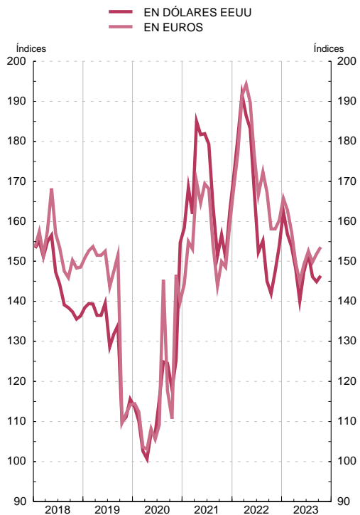
ÍNDICES DE PRECIOS DE MATERIAS PRIMAS NO ENERGÉTICAS