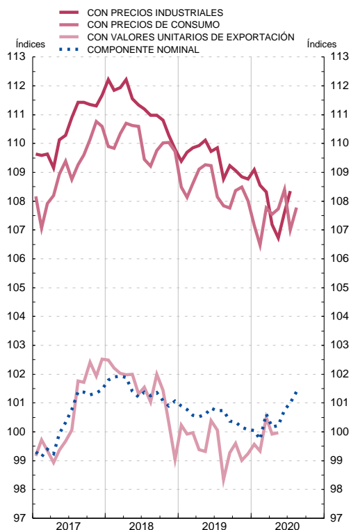
ÍNDICES DE COMPETITIVIDAD DE ESPAÑA FRENTE A LOS PAÍSES DESARROLLADOS