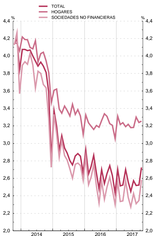
PRÉSTAMOS Y CRÉDITOS TIPOS SINTÉTICOS