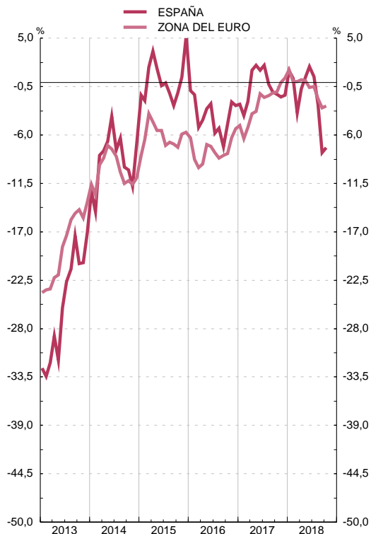
INDICADOR DE CONFIANZA CONSUMIDORES Saldos, corregidos de variaciones estacionales