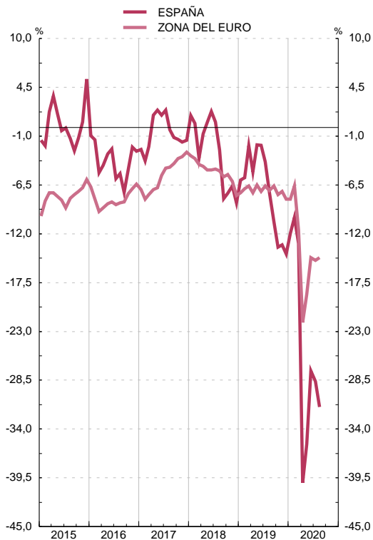
INDICADOR DE CONFIANZA CONSUMIDORES Saldos, corregidos de variaciones estacionales