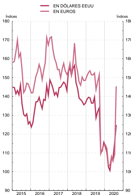
ÍNDICES DE PRECIOS DE MATERIAS PRIMAS NO ENERGÉTICAS