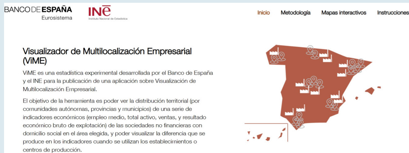
Figura 1 Página de presentación de la aplicación ViME

En resumen, este nuevo producto estadístico de carácter experimental ofrece diversas opciones para los usuarios que deseen analizar el fenómeno de la multilocalización empresarial, mediante una aplicación interactiva y personalizable según sus necesidades específicas.