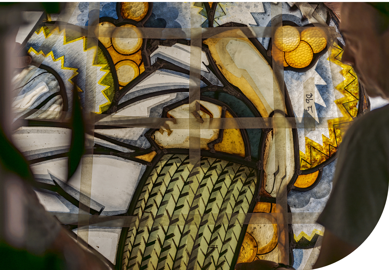
Restauración de una vidriera art déco diseñada por la Casa Maumejean.

En 2025 se restauraron dos vidrieras art déco situadas en la escalera del edificio ampliación. Diseñadas en los años treinta del siglo XX por la Casa Maumejean, empresa familiar fundada en 1860 y experta en vidrieras artísticas, las piezas forman parte de un conjunto decorativo más amplio que engloba el patio de operaciones de la institución, considerado por los expertos como uno de los espacios art déco europeos más importantes. La empresa especializada Vetraria se encargó del trabajo, que incluyó el desmontaje completo, la numeración y clasificación de los paneles, la limpieza y consolidación de la estructura, la restauración del emplomado y el montaje final. Además, elaboramos un estudio histórico y un registro fotográfico detallado. Con esta intervención aseguramos la estabilidad y conservación de las vidrieras, testimonio del proyecto arquitectónico que introdujo la modernidad en la sede de Cibeles del Banco de España.