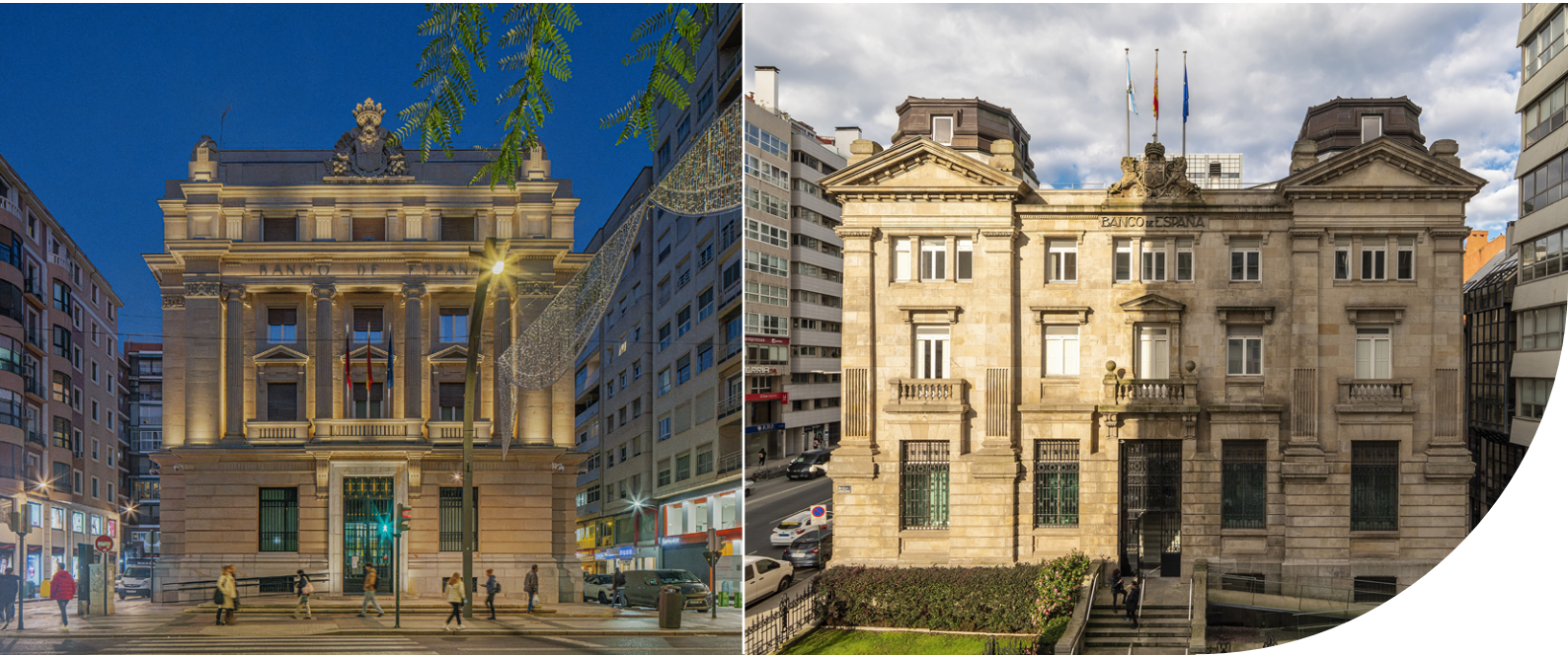
Fachadas de las sucursales del Banco de España en Murcia (izquierda) y A Coruña (derecha).

Recientemente se ha creado el Departamento de Experimentación y Laboratorio de Tecnologías Aplicadas (DELTA), con sede en la sucursal de Barcelona. Esta medida permite aprovechar la cercanía al Barcelona Supercomputing Center y avanzar en el desarrollo de proyectos conjuntos para impulsar el uso de la inteligencia artificial en el sector financiero.