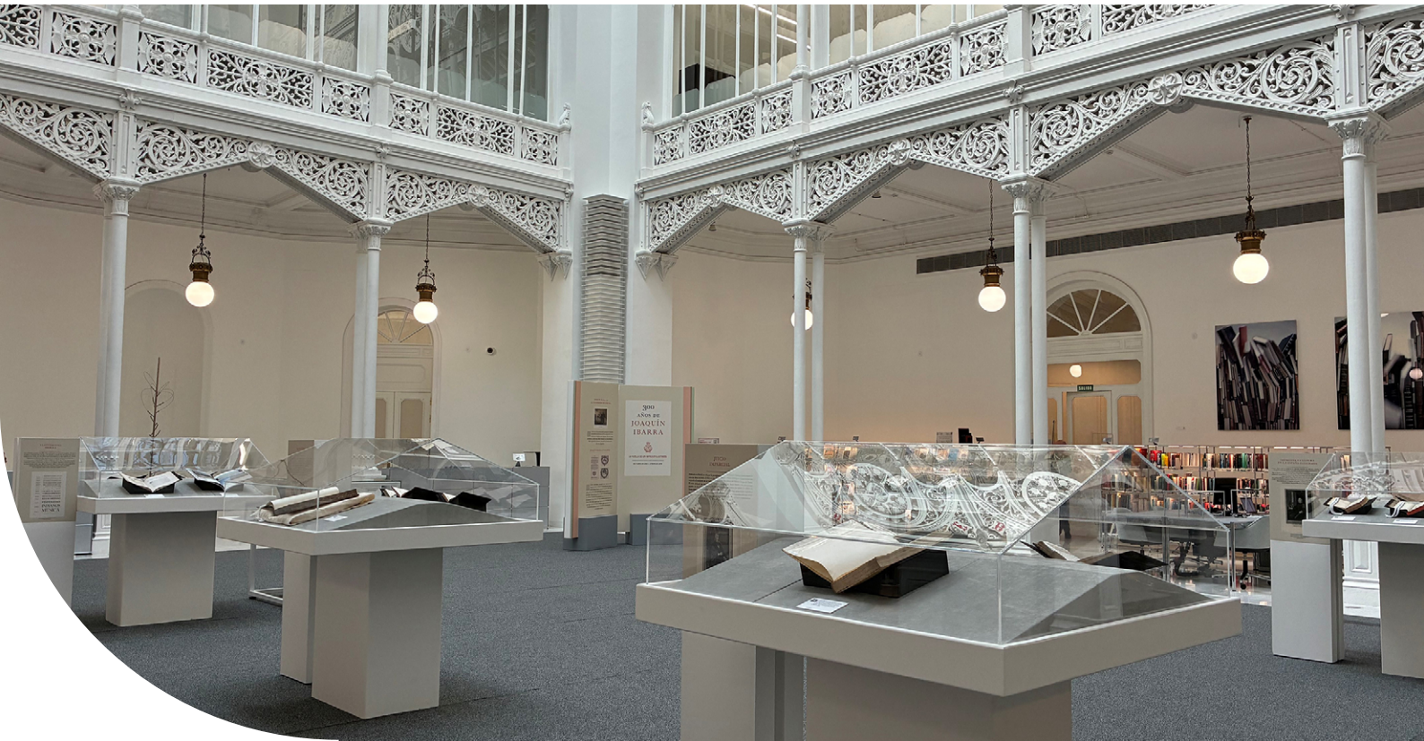
Exposición «300 años de Joaquín Ibarra: la huella de un impresor ilustrado» en la biblioteca de la sede central del Banco de España.