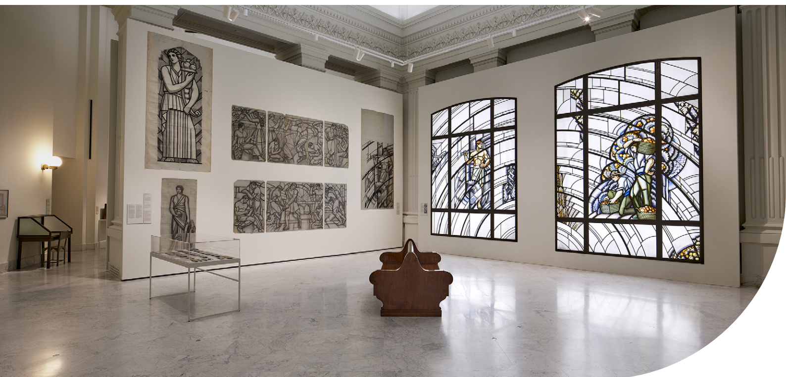
Vista de la exposición «Alegorías de un porvenir».