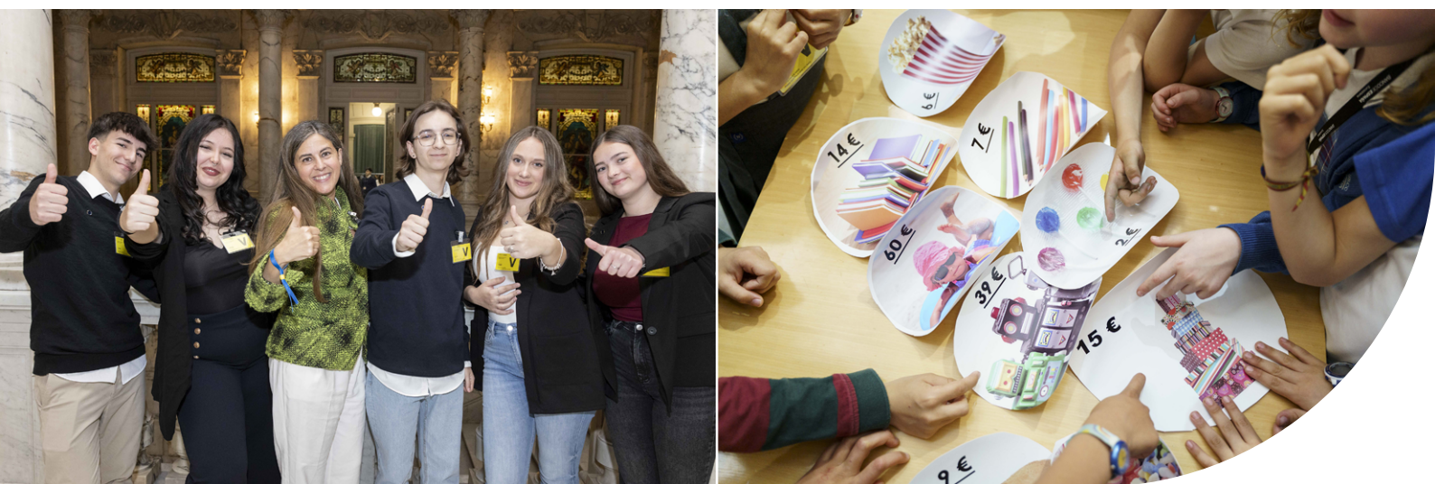
Uno de los equipos finalistas de la 14.ª edición del concurso Generación Euro (izquierda). Taller celebrado en la sede central del Banco de España con motivo de la Semana de la Administración Abierta (derecha).

Destaca también el Portal del Cliente Bancario, que recibió más de 4,6 millones de visitas en 2025. El portal ofrece información clara sobre derechos y obligaciones de usuarios del sistema bancario, así como sobre productos y servicios financieros. Además, facilita el contacto con el Banco de España para consultas y reclamaciones.