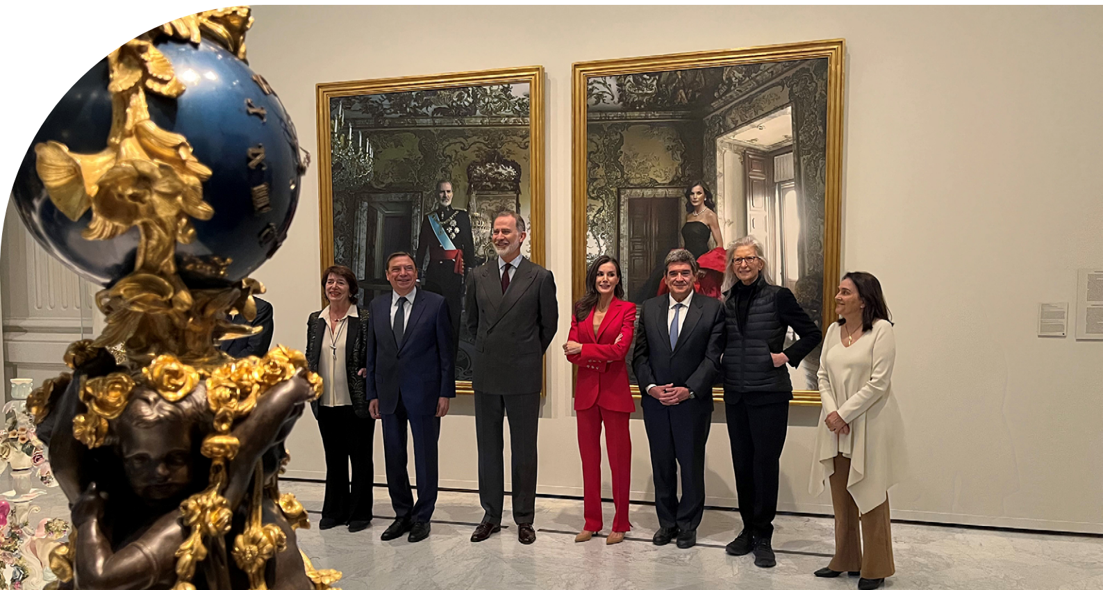
Sus Majestades los Reyes de España visitaron en febrero de 2025 la exposición «La tiranía de Cronos», en la que destacaron los retratos realizados por Annie Leibovitz por encargo del Banco de España.

| Prestamos 24 obras | a 12 exposiciones temporales