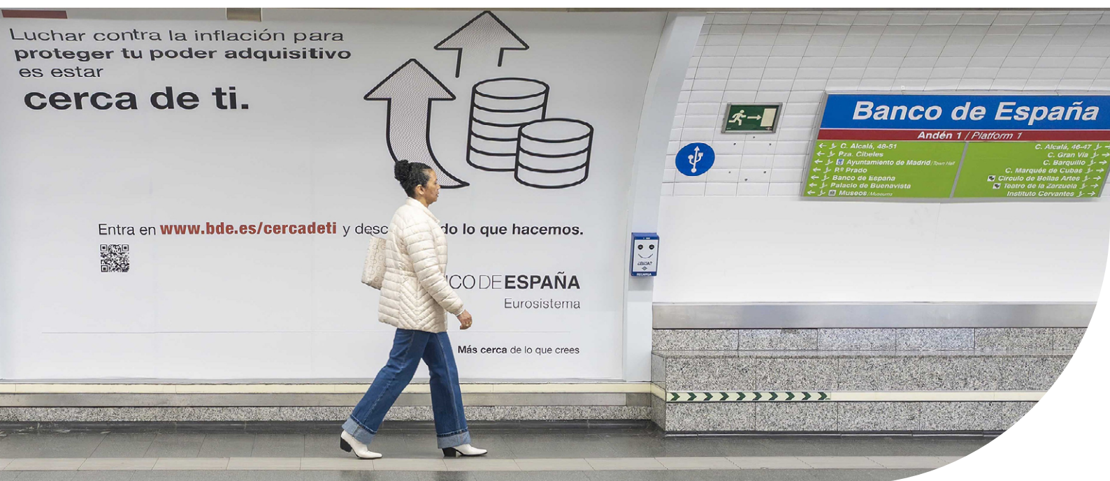
Andén de la estación de Banco de España decorado con un panel publicitario de la campaña «Cerca de ti», iniciativa divulgativa del Banco de España en colaboración con Metro de Madrid.

La campaña tuvo una buena acogida entre la ciudadanía, según los indicadores y las encuestas hechas en abril. Difundió con éxito las funciones del Banco y generó un tráfico relevante hacia la web a través de distintos canales, como refleja el número de visitas a la página principal