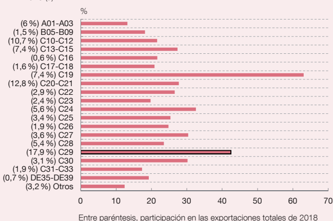
Gráfico 2 CONTENIDO IMPORTADOR DE LAS EXPORTACIONES DE BIENES POR RAMAS EN 2016 (a)