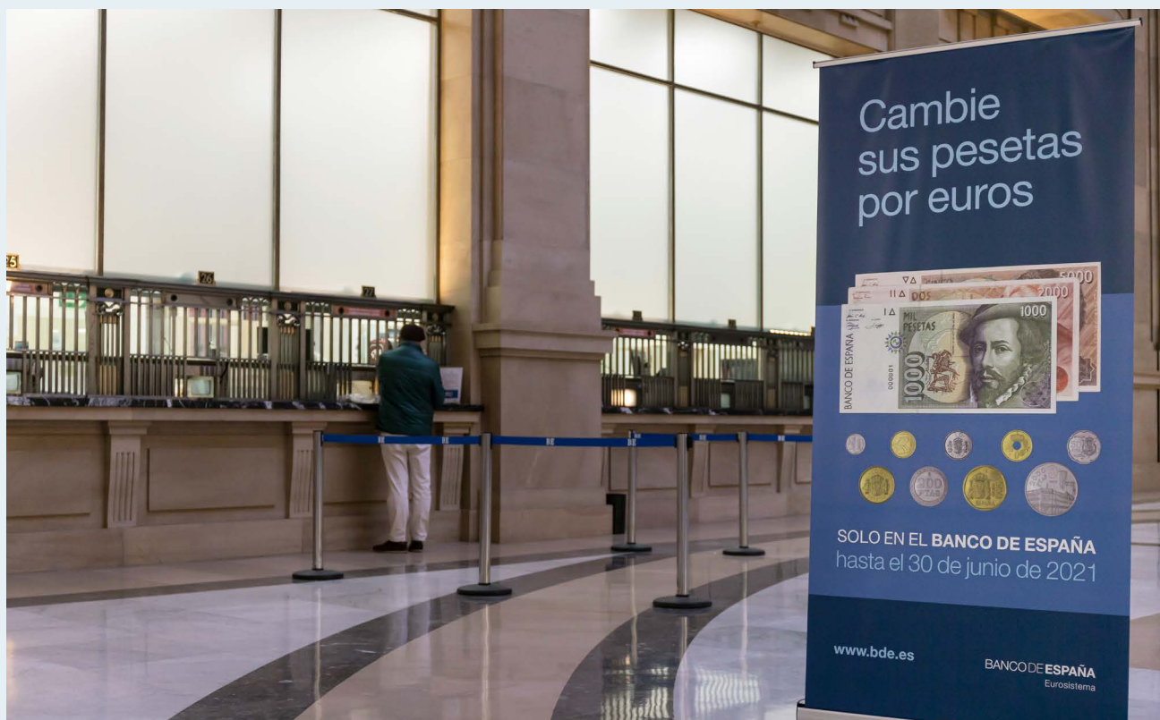
El canje de pesetas por euros puede realizarse tanto en la sede central del Banco de España en Madrid (C/ Alcalá, 48) como en sus sucursales.

En 2020 se han canjeado billetes y monedas en pesetas por un contravalor de 14,5 y 4,4 millones de euros, respectivamente.