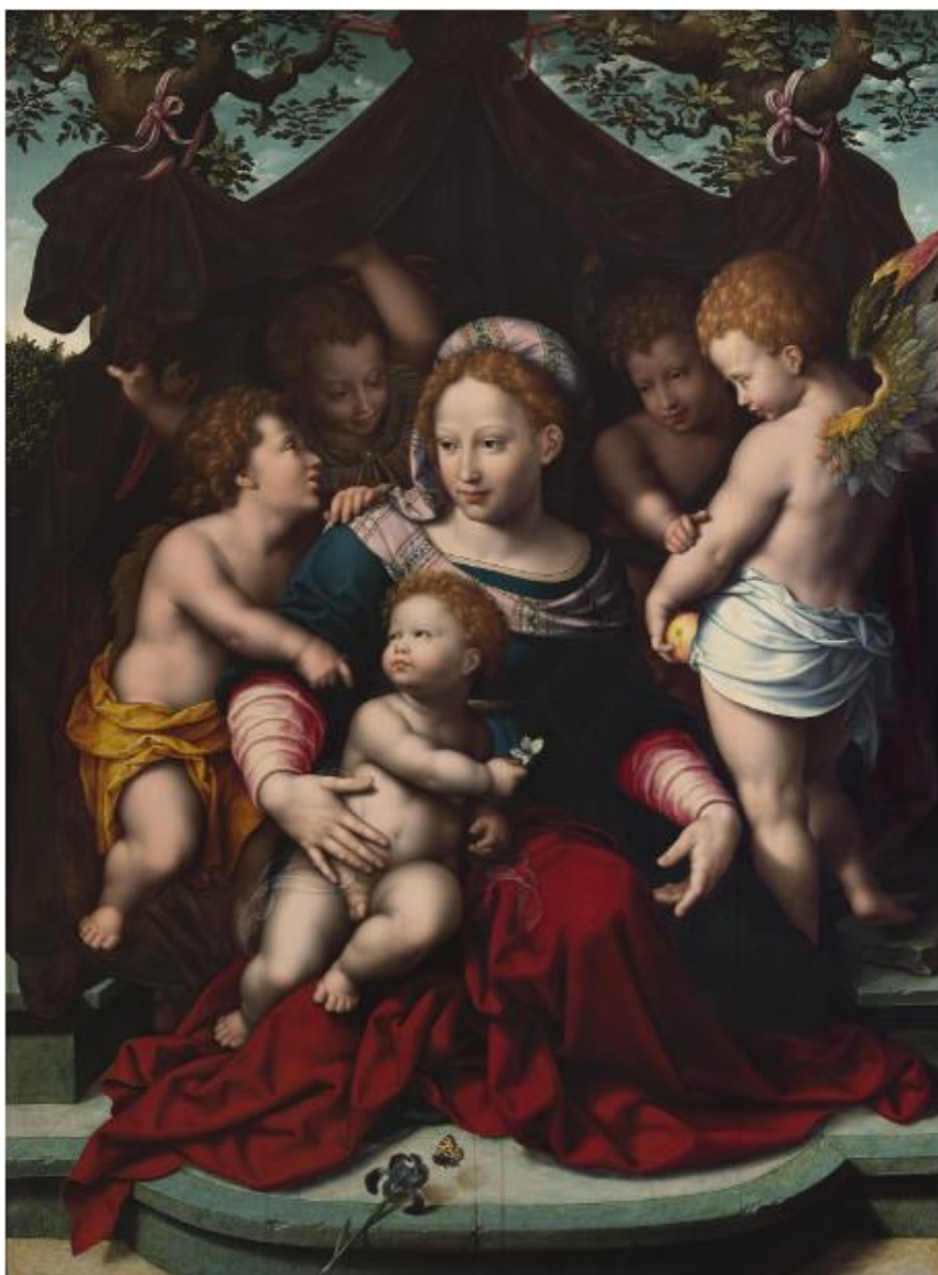
CORNELIS VAN CLEVE

La exposición reúne, asimismo, un reducido grupo de obras de iconografía religiosa que formaron parte del Oratorio de la primitiva sede del Banco en la calle de la Luna. Resulta revelador que el motivo esgrimido para habilitar la capilla en el propio establecimiento estuviese claramente relacionado con la preocupación por la productividad de sus empleados, que de ese modo podrían cumplir con sus obligaciones religiosas sin tener que abandonar el edificio. Del Oratorio procede una de las obras maestras de la colección de La virgen del Lirio de Cornelis van Cleve.