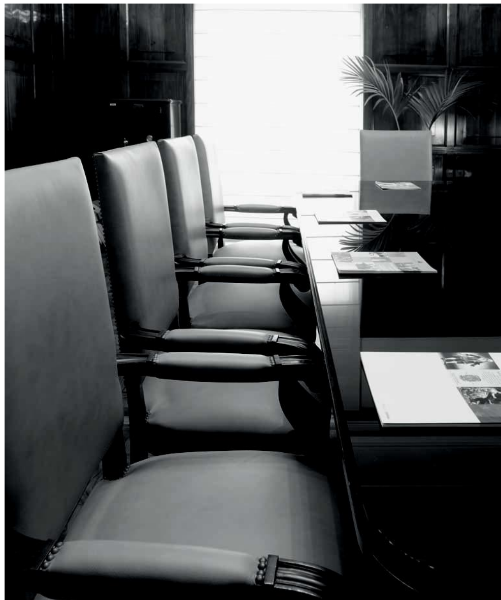
Sala de Juntas.

En 1918 se adquieren los terrenos para la construcción del edificio definitivo. Para ello es necesario demoler edificaciones anteriores y hasta 1926 no comienzan las obras, que duran hasta 1931.