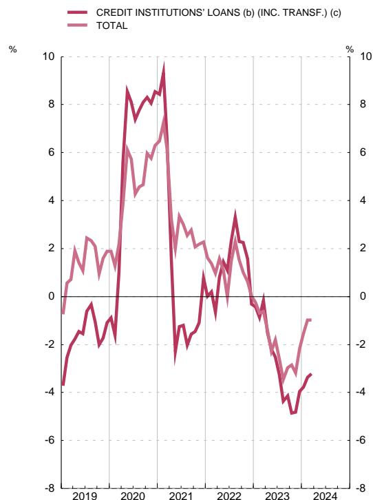
FINANCING OF NON-FINANCIAL CORPORATIONS Annual percentage change