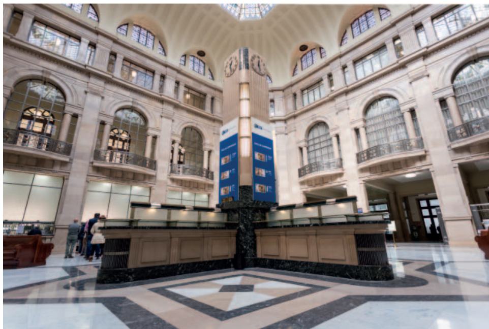
Patio de Operaciones de Madrid en la presentación del nuevo billete de 50 euros de la serie Europa.

El efectivo desempeña un papel importante en el sistema de pagos español. Según revela un estudio realizado recientemente por el BCE, con cifras referidas a 2016, el 87 % de las transacciones en los puntos de venta se saldaron con billetes y monedas.