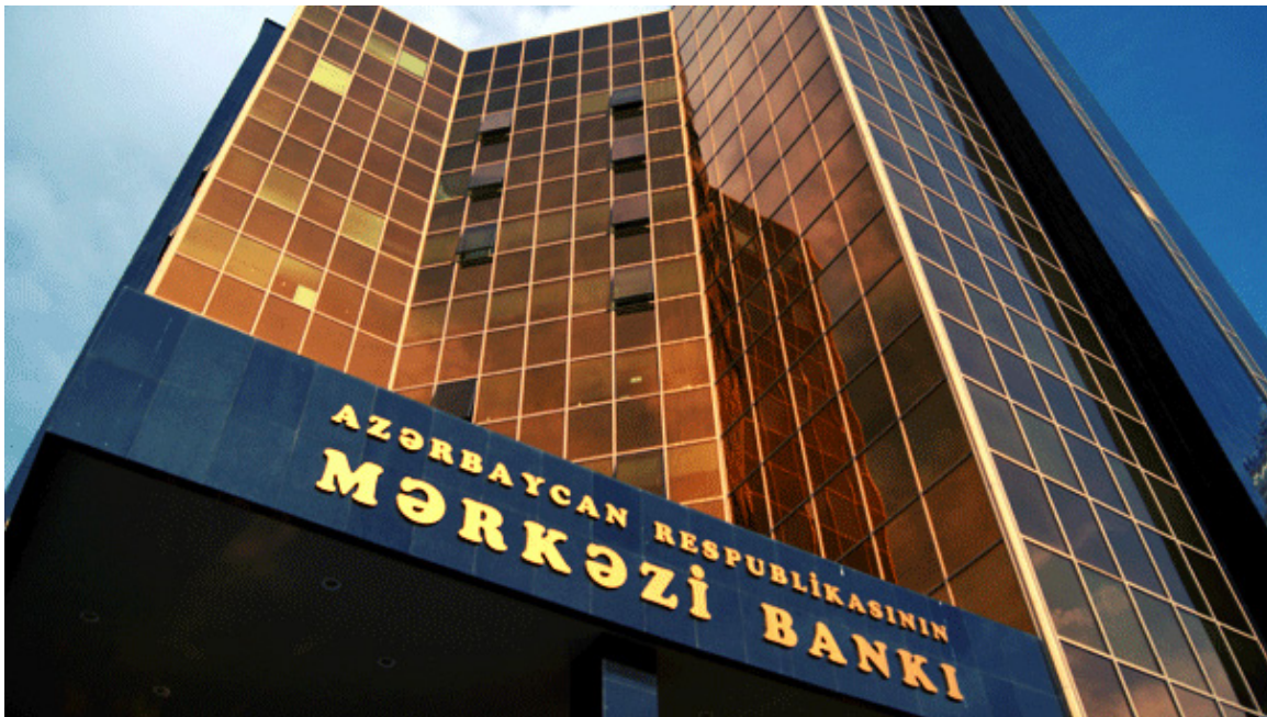
Banco Central de la República de Azerbaiyán.

Queremos destacar una misión desarrollada en 2021 junto con el Banco Central de la República de Azerbaiyán. Se trata de una misión que esta institución solicitó al Banco de España en 2019, planificada para que dos expertos de nuestro Departamento de Recursos Humanos viajaran al banco central de ese país durante varios días para compartir in situ con sus equipos conocimientos técnicos y experiencias sobre esta área.