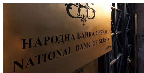
Banco Central de Serbia.

Durante esos dos días, un total de siete especialistas, expertos y técnicos de las divisiones de Relaciones Europeas y de Relaciones Internacionales del Departamento de Relaciones Internacionales y Europeas y de la División de Política Regulatoria Global y Análisis de Impacto del Departamento de Regulación del Banco de España, expusieron y presentaron a un equipo de seis expertos del Banco Nacional de Serbia muy diversos aspectos de las relaciones internacionales del SEBC