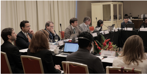
Reunión de un evento organizado por el Banco de la República, conjuntamente con el BIS y el CEMLA, en Cartagena de Indias.

La interacción entre bancos centrales desempeña un papel fundamental en el fortalecimiento de las capacidades para la conducción de la política monetaria y de las funciones a cargo de los bancos centrales. Esta trae consigo múltiples beneficios, como el desarrollo de competencias y capacidades, la transferencia de conocimientos y de buenas prácticas y el intercambio de puntos de vista sobre diversos temas de interés. El convenio firmado con el Banco de España, que se encuentra en fase de implementación, ha sido un pilar fundamental en las actividades de cooperación internacional del Banco de la República.