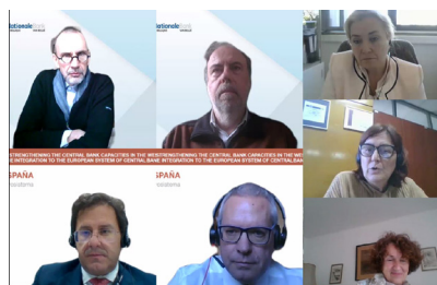
Auditoría de la ciberseguridad.

En los primeros encuentros, con vistas a la preparación del evento, descubrimos que nuestros compañeros belgas y eslovenos eran caras conocidas: una auditoría en 2016, un grupo de trabajo en 2018, un seminario en 2020, lazos cruzados y experiencias compartidas en alguna que otra actividad del IAC. Esto, sin duda, se reflejó en los días del