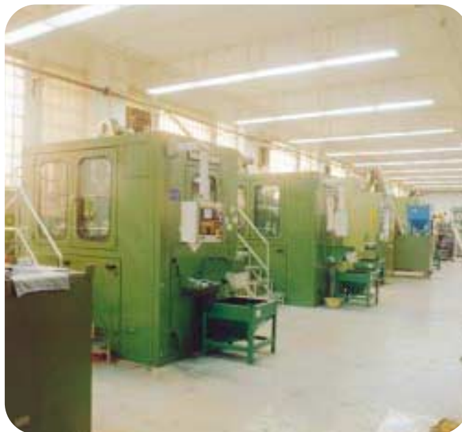
Taller de Acuñación en la actualidad Las prensas acuñan más de 700 monedas por minuto

Tradicionalmente, los billetes han tenido una iconografía muy variada, y han recogido motivos referentes a personalidades destacadas, a actividades económicas o a ideales y valores. Del mismo modo que su hermana, la moneda, los billetes han cambiado a lo largo de estos años en tamaño y valor y se han ido incorporando diferentes medidas de seguridad.