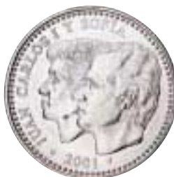
Moneda conmemorativa de 2.000 pesetas. Acuñación 2001