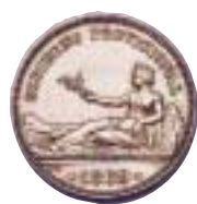
1 peseta del Gobierno Provisional, de 1869

Las primeras piezas se acuñaron en 1869, siendo la unidad la primera en ver la luz, tras una primera vacilación que hace aparecer