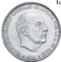
100 pesetas de Franco, de 1966. De plata y ya de Ávalos