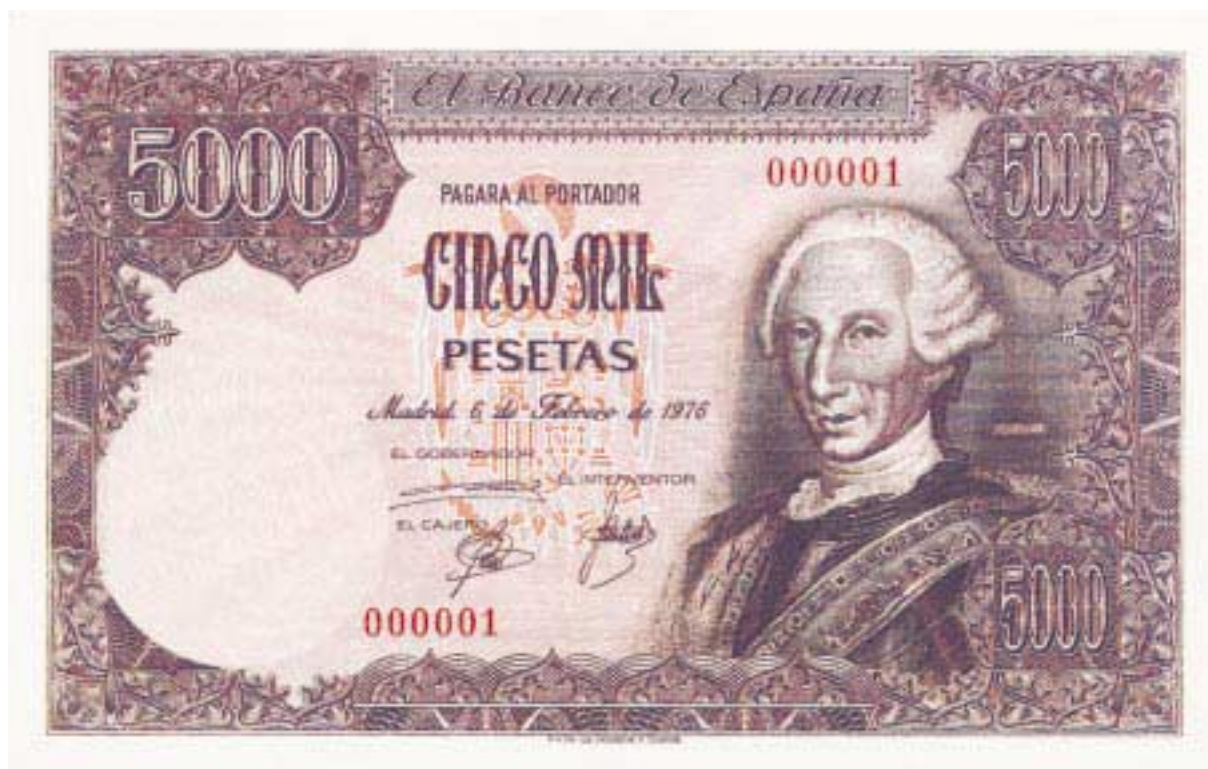
5.000 pesetas. 6 de febrero de 1976 Primer billete con este valor nominal en pesetas. F.N.M.T.

La primera emisión que realizará la Fábrica Nacional de Moneda y Timbre será la de 21 de octubre de 1940, venciendo grandes dificultades técnicas y de suministro de materias primas. El Gobierno, por Decreto de 24 de junio de 1941, toma la decisión de encomendar el proceso de producción de papel moneda a la F.N.M.T., y dotarla de los medios adecuados para no tener que depender más de fabricantes extranjeros en una cuestión de tanta trascendencia. A pesar de las dificultades iniciales, desde entonces ha realizado esta tarea en una constante superación, incorporando las nuevas tecnologías y manteniendo un reconocido nivel de calidad. Con la llegada del euro, seguirá interviniendo y colaborando en el proceso de fabricación de los nuevos billetes junto a otros fabricantes europeos por encargo del Banco Central Europeo.