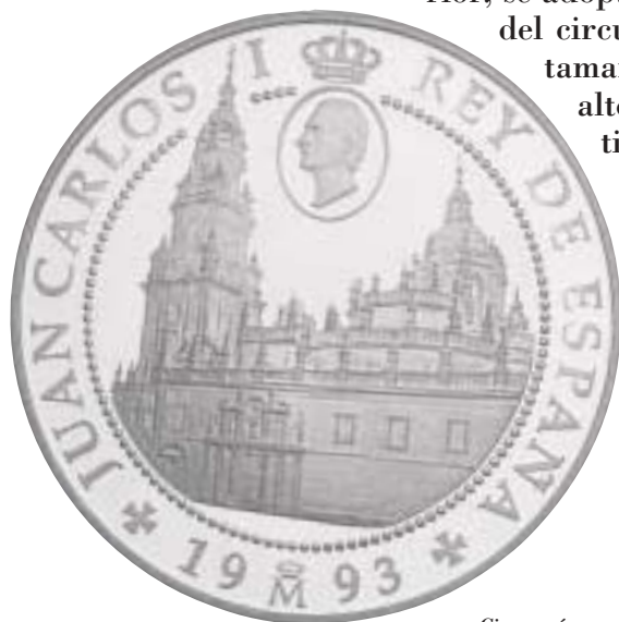
Cincuentín, 1.ª serie del Jacobeo

Las emisiones posteriores continúan la política de ensayo de nuevos metales y de regularización del sistema monetario, que se verá alterada por la acuñación de nuevos valores a partir de 1982. En 1990, y ante la confusa diversidad provocada por la acuñación de las 2, 5, 100 y 200 pesetas en metales y módulos discordantes con el resto de las series en circulación, confusión agravada por la permanencia de valores del período anterior, se adopta una solución drástica. La renovación formal del circulante se basa en el diseño, en el aumento del tamaño de las monedas en relación a su valor y en la alternancia de color del metal, permitiendo su distinción con mayor facilidad, aunque realmente se consigue en 1997 cuando dejan de tener valor de circulación todas las demás monedas.