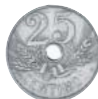
25 ctmos. de Alfonso XIII, de 1927. Cuproníquel y con agujero

Las emisiones posteriores continúan la política de ensayo de nuevos metales y de regularización del sistema monetario, que se verá alterada por la acuñación de nuevos valores a partir de 1982. En 1990, y ante la confusa diversidad provocada por la acuñación de las 2, 5, 100 y 200 pesetas en metales y módulos discordantes con el resto de las series en circulación, confusión agravada por la permanencia de valores del período anterior, se adopta una solución drástica. La renovación formal del circulante se basa en el diseño, en el aumento del tamaño de las monedas en relación a su valor y en la alternancia de color del metal, permitiendo su distinción con mayor facilidad, aunque realmente se consigue en 1997 cuando dejan de tener valor de circulación todas las demás monedas.