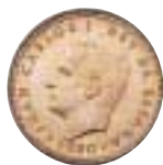
1 peseta de la Monarquía. Acuñación conmemorativa del Campeonato Mundial de Fútbol «ESPAÑA 82»