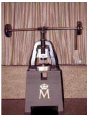
Reproducción de la prensa de volante

L A moneda es un fiel reflejo de la Historia. Dentro de sus pequeñas dimensiones se encierran todas las coordenadas del momento en que se acuñó y es siempre una inagotable fuente de información. Las concepciones estéticas, políticas, religiosas y la situación económica de los pueblos quedan indeleblemente plasmadas en esos pequeños discos de metal. Por tanto, los 134 años en los que la peseta ha mandado en la economía de España han visto pasar acontecimientos trascendentales en la conformación de lo que hoy es la vida de los españoles. Por las manos de los ciudadanos han pasado reyes, artistas y conquistadores; la peseta se ha convertido en pieza clave de la iconografía popular: anhelada, aborrecida, idolatrada..., en definitiva, la historia de la peseta es, en buena parte, la historia de los hombres y mujeres españoles que entraban en el mundo moderno.