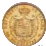
20 pesetas de Alfonso XIII, de 1904. Última de oro

AUNQUE el Decreto de octubre de 1868 establecía la emisión de catorce valores diferentes, de los que solamente se acuñaron nueve, serán los años siguientes hasta el reinado de Alfonso XIII los que verán cumplido, y aun superado por nuevas denominaciones, lo previsto en dicho Decreto. Así, de los valores en oro, las 50 y 5 pesetas no llegaron a acuñarse, pero sí lo fueron las 100, 20 y 10 pesetas, aunque en diferentes momentos, así como un valor nuevo, el de 25 pesetas. En plata y bronce, al ser moneda más necesaria y de mayor circulación que el oro, las emisiones requieren también mayor regularidad, y no se elimina ni añade ningún valor.