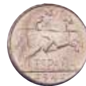
10 ctmos. de Franco del jinete. 1940. Aluminio