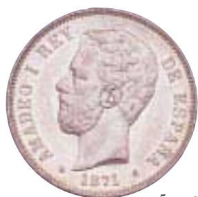
5 pesetas de Amadeo I. Escudo de Saboya