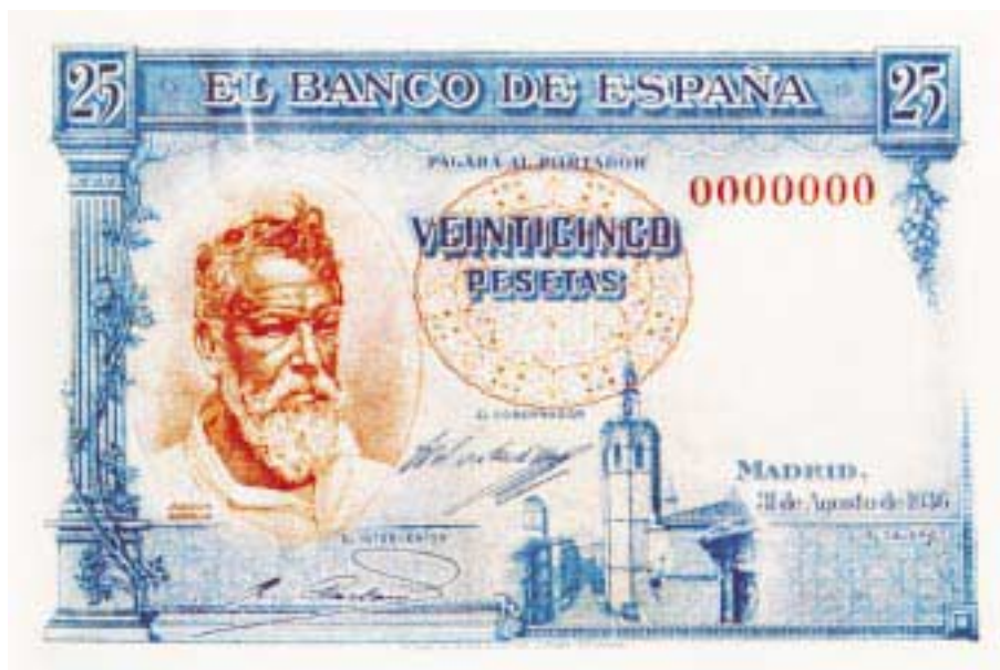
25 pesetas. 31 de agosto de 1936 Emitido por el Gobierno de la República y realizado en Inglaterra

la falta de moneda divisionaria se hará acuciante, dando lugar a la proliferación de medios de pago emitidos por todo tipo de organismos, tanto de carácter público como privado, en un ámbito puramente local, normalmente de pequeña cuantía, que permitiera las transacciones elementales de la vida cotidiana.