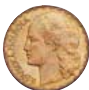
Peseta de la II República, de 1937. La rubia