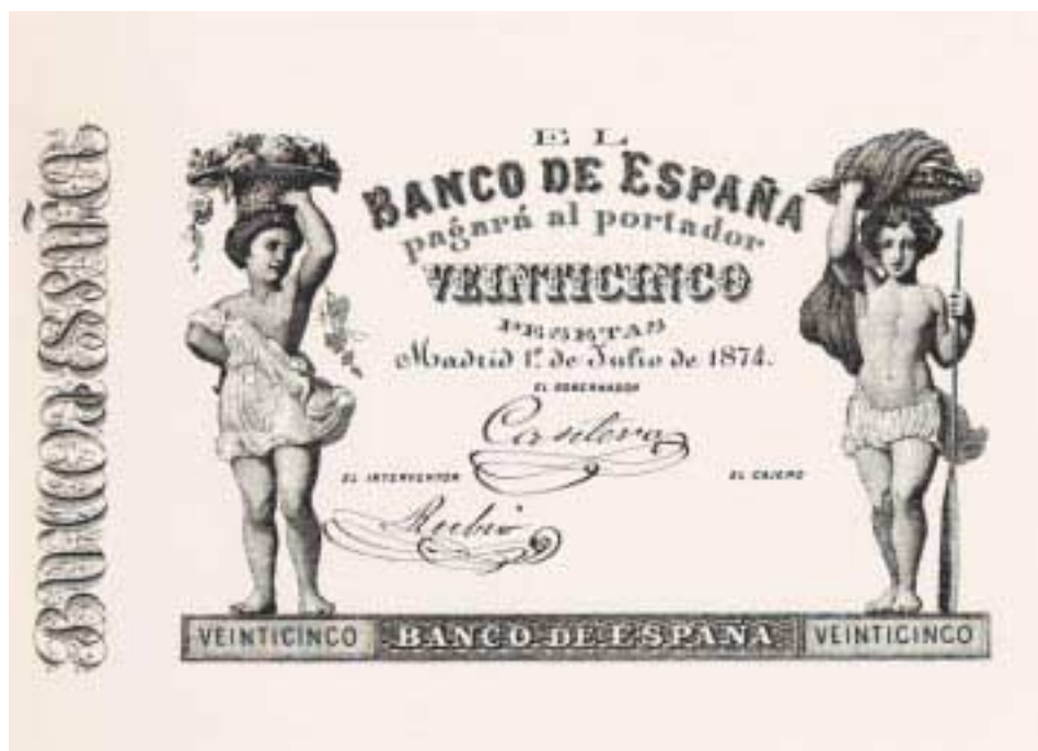
25 pesetas. 1 de julio de 1874. Primera emisión con valor nominal en pesetas Realizado en los talleres del Banco de España

LA llegada del EURO supone, como es bien sabido, la desaparición de monedas y billetes nacionales y, por tanto, de la PESETA, cerrándose una etapa de existencia en la que ha funcionado como unidad del sistema monetario español, desde la reforma establecida por Decreto de 19 de octubre de 1868, para adecuar nuestro sistema al de la Unión Monetaria Latina. El camino recorrido desde la primera emisión hasta la actualmente en vigor ha estado lleno de vicisitudes en cuanto a su difusión y crecimiento, tanto desde el punto de vista económico y político, como desde los avances técnicos en el proceso de fabricación, que permiten realizar una mirada retrospectiva destacando lo más característico de cada uno de estos aspectos.