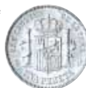
1 peseta (plata) Alfonso XIII, 1893

La Segunda República marcará la ruptura tipológica, introduciendo motivos de inspiración republicana acordes con el carácter político del nuevo gobierno.