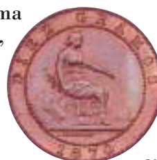
10 ctmos. del Gobierno Provisional, de 1870

Para los reversos se dispone, en la plata, el escudo de España con corona mural y la leyenda con la expresión del valor, la talla (número de piezas en kilogramo), las iniciales de los ensayadores y juez de balanza, y la ley de 900 milésimas en las cinco pesetas. El bronce, con un león rampante sosteniendo el escudo de España, ha dado pie a la anécdota que otorgó el nombre popular de «perra gorda» y «perra chica» a los diez y cinco céntimos, pues la gente vio un perro donde había un león. La fabricación en este metal continúa contratándose, como ya se hiciera desde 1865, con la firma «Oeschger, Mesdach y Cía.», cuyas iniciales, O.M., aparecerán en las monedas hasta el reinado de Alfonso XII, si bien la elaboración de punzones, troqueles y virolas continuará centralizada en la Casa de Moneda de Barcelona.