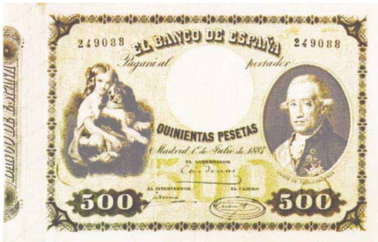
500 pesetas. 1 de julio de 1874. Primer billete con espacio reservado para marca de agua Realizado en los talleres del Banco de España

La primera emisión de papel moneda que expresa su valor en pesetas, de 1 de julio de 1874, coincide con la concesión al Banco de España de la exclusividad del derecho a emitir billetes, hasta entonces compartido con otros Bancos provinciales. El punto de partida arranca con una dificultad puramente material, la de sustituir las emisiones provinciales por las realizadas por el Banco de España, que hasta entonces sólo operaba en Madrid. La nueva legislación preveía la apertura de sucursales del Banco en las principales plazas del territorio nacional y la retirada paulatina de los antiguos billetes, proce-