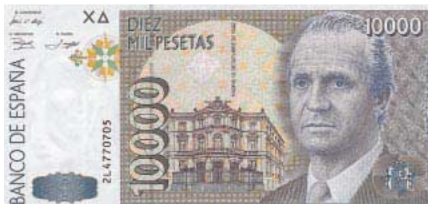
10.000 pesetas. 12 de octubre de 1992 Última emisión con valor nominal en pesetas. F.N.M.T.

LOS temas representados en los billetes han respondido a diversas motivaciones, la mayor parte de las veces para rendir homenaje a personalidades destacadas en los más diversos ámbitos que forman parte de nuestra historia. En las primeras emisiones era frecuente encontrar alegorías de contenido económico (el Comercio, el Trabajo, la Agricultura, la Industria, ...), ideológico y de exaltación de valores (la Justicia, la Familia, la Libertad, la República, ...) o dedicadas a las Bellas Artes. Pero la efigie de monarcas, pintores, escritores, científicos..., etc., ha acaparado la viñeta principal del anverso, siendo la más representada la de Francisco de Goya. Dos emisiones completas han sido dedicadas a su figura, y tres de sus obras: «El Quitasol», «El Cacharrero» y «El Bebedor» aparecen en los reversos, magníficamente realizados. Las imágenes de Quevedo, Calderón de la Barca, Bécquer o Rosalía de Castro, que junto con la reina Isabel la Católica son los únicos personajes femeninos no alegóricos retratados en el anverso, han sido difundidas a través del billete. Monumentos, pasajes literarios y acontecimientos como el Descubrimiento de América y sus protagonistas, han estado también representados, siendo Cristóbal Colón uno de los personajes más retratados, ilustrando, así mismo, la emisión de 1992, conmemorativa del V Centenario.