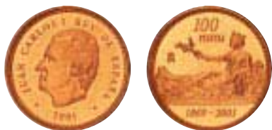
Moneda de 100 pesetas. Acuñación 2001

Ya en la historia monetaria más reciente, la normalización del circulante a partir de 1990 impone una renovación tipológica en la que los motivos son diferentes cada año, excepto en las monedas de 1 y 500 pesetas, desarrollando así la intención conmemorativa que tímidamente se había iniciado con la serie de los Mundiales de Fútbol en 1980. Rompiendo con la tradición de representar sistemáticamente la efigie del gobernante en anverso y el escudo de España en reverso, se introducen motivos alusivos a las comunidades españolas y a manifestaciones artísticas y culturales.