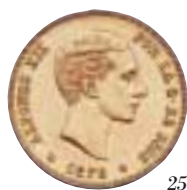
25 pesetas de Alfonso XIII. Valor no previsto