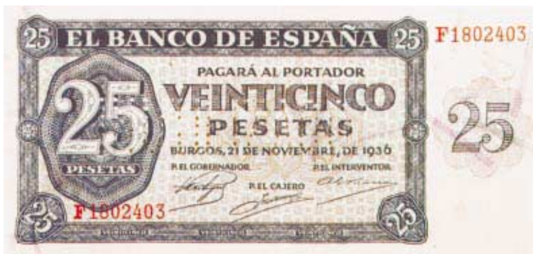
Emitido por el Gobierno de Burgos y fabricado en Alemania

Al finalizar la guerra la reconstrucción es necesaria en todos los sectores, y la vuelta a la normalidad de la circulación fiduciaria requerirá también un gran esfuerzo.