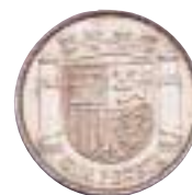
Peseta de la II República, de 1933. Última en plata