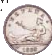
1 peseta de España, de 1869

el nombre del GOBIERNO PROVISIONAL en el anverso en lugar del de la nación, ESPAÑA, que ya figura en las siguientes acuñaciones y para todos los valores en plata, junto con la fecha de emisión y las estrellas con la fecha de acu-