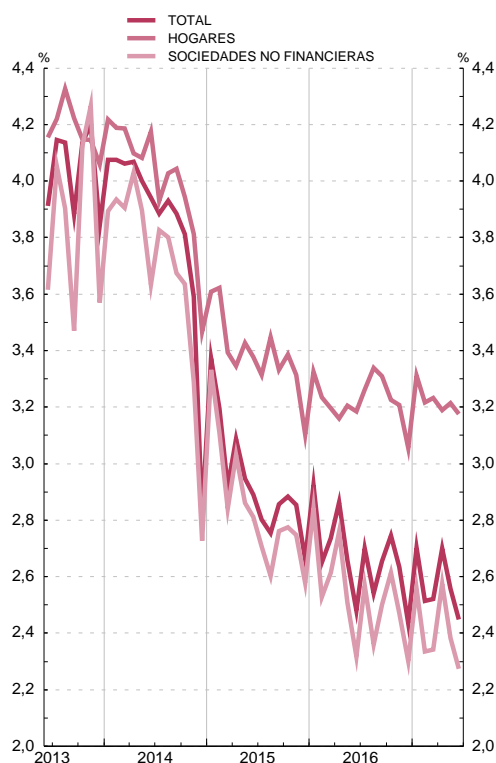
PRÉSTAMOS Y CRÉDITOS TIPOS SINTÉTICOS