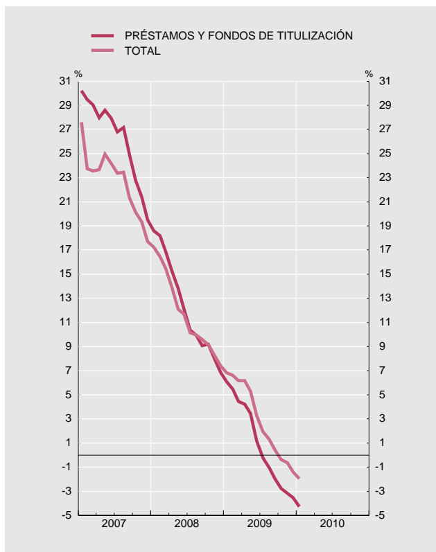
FINANCIACIÓN A LAS SOCIEDADES NO FINANCIERAS Tasas de variación interanual