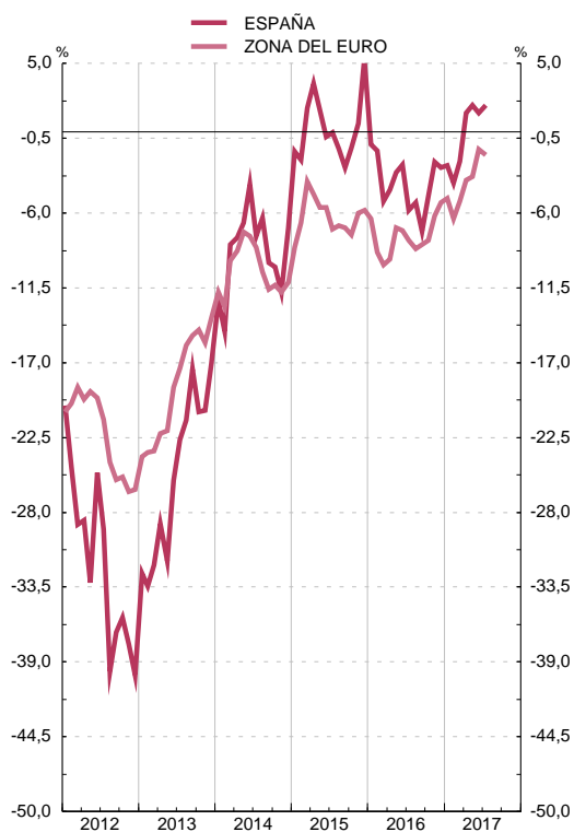
INDICADOR DE CONFIANZA CONSUMIDORES Saldos, corregidos de variaciones estacionales