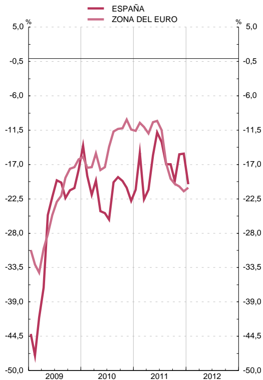
ÍNDICE DE CONFIANZA CONSUMIDORES