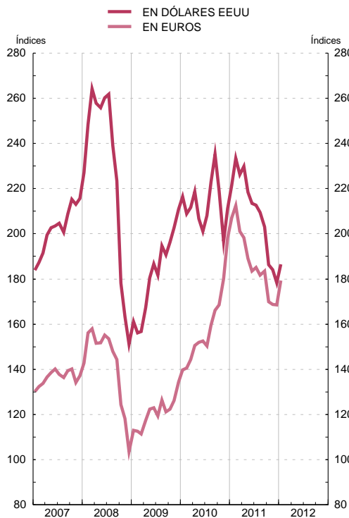
ÍNDICES DE PRECIOS DE MATERIAS PRIMAS NO ENERGÉTICAS