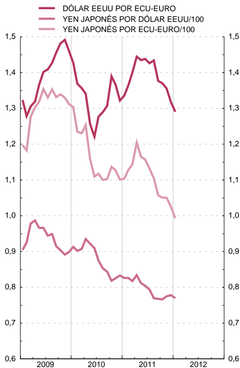
TIPOS DE CAMBIO BILATERALES