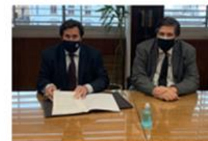
Diego Labat (Izquierda), presidente del Banco Central del Uruguay, y Jorge Oteiza, secretario general.

Actualmente, el Banco de España tiene suscritos 14 acuerdos internacionales de cooperación, en su mayor parte con bancos centrales o con instituciones financieras iberoamericanas. El Plan Estratégico 2020-2024 constituye, desde su aprobación, una referencia básica a la hora de seleccionar las instituciones con las que se formalizan estos acuerdos y de definir las líneas de actuación para su desarrollo.