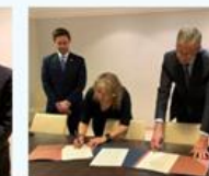
Momento de la firma del acuerdo suscrito entre el Banco de España y el Banco Central del Ecuador.

Para alcanzar sus objetivos, el acuerdo prevé distintas modalidades de cooperación y asistencia técnica, que pueden abarcar el desarrollo de estudios y proyectos de investigación, la coordinación de reuniones de expertos y la provisión de asistencia técnica especializada. A lo anterior se suman otras actividades de intercambio de conocimientos y experiencias en materia de banca central y áreas de soporte.