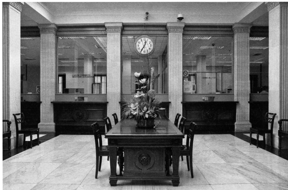
Patio de operaciones. Pati d'operacions.