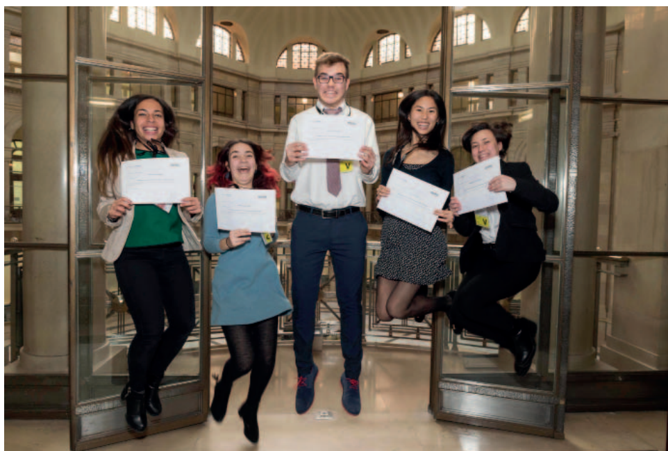
Estudiantes del Instituto Camilo José Cela de Madrid, ganadores de la 7.ª edición del Concurso Generación Euro.

Por otra parte, durante 2018, en el convencimiento de que la educación es un arma de gran importancia en la lucha contra la falsificación, el Banco de España impartió formación sobre billetes y monedas —tanto de forma presencial como on-line —, e instruyó a casi 2.000 personas de diferentes colectivos (profesionales del efectivo, de las fuerzas y cuer-