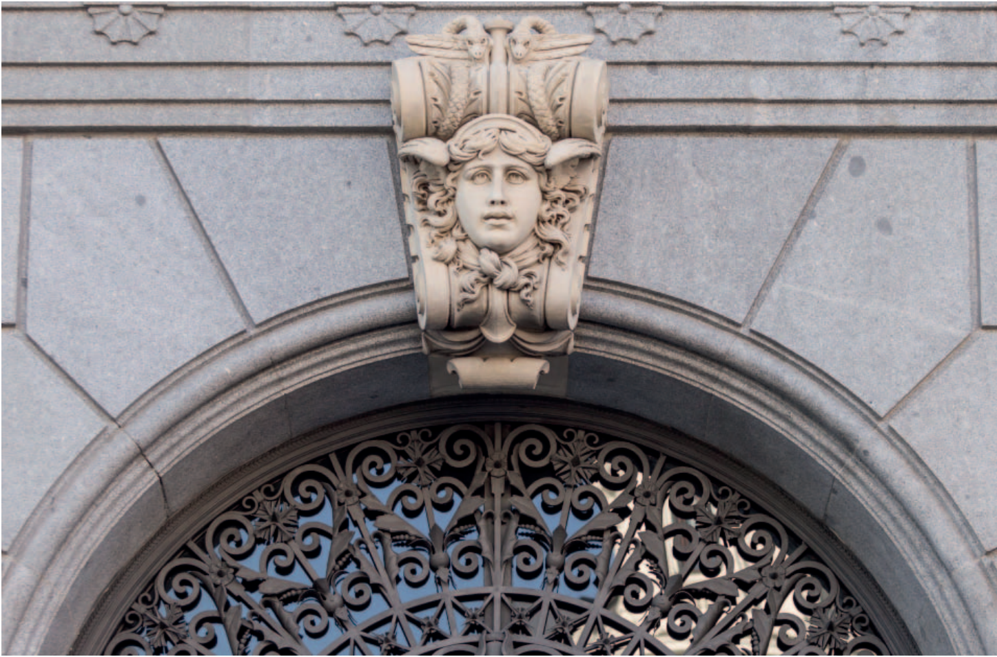
Clave en forma de cabeza de Mercurio en terracota pintada.