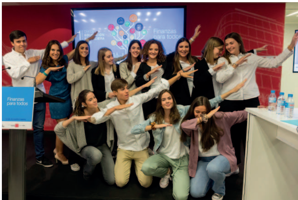
Finalistas de la última edición del concurso de conocimientos financieros Finanzas para Todos.

financieros, y quedó como subcampeón el Colegio San Francisco Javier (Jesuitas) de Tudela.