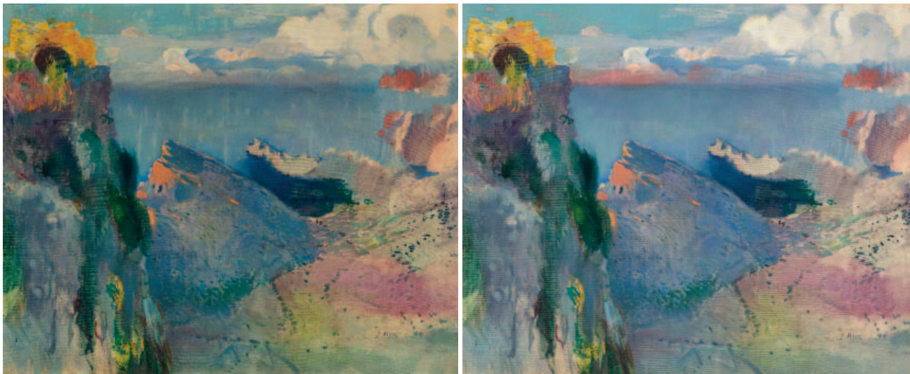
Cala Sant Vicenç (1903), de Joaquim Mir. Antes y después de su restauración.

Diecisiete obras de la colección del Banco de España y de elementos de artes decorativas fueron objeto de restauración.