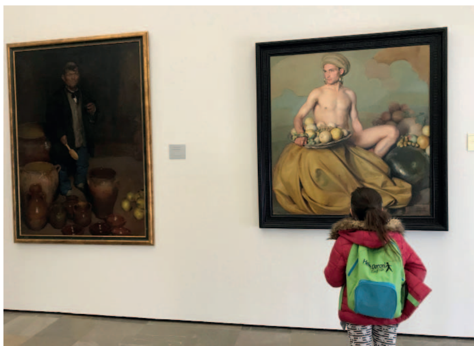
Dios de la fruta , una de las obras más representativas de Gabriel Morcillo, en el Museo de Bellas Artes de Granada.

Con el mismo objetivo de difusión, se puso en marcha la creación del sitio web patrimonial, en colaboración con el Departamento de Sistemas de Información y la División de Imagen Institucional, que albergará la colección de pintura, dibujo, escultura y fotografía; su presentación está prevista para el primer semestre de 2019. Para completar este capítulo, y continuando con el proyecto de realización de un catálogo razonado de la colección puesto en marcha en 2015, finalizó el proceso de fotografiado y de revisión exhaustiva de las más de 1.800 obras que lo componen. Tanto el catálogo como la web verán la luz en el primer semestre de 2019.