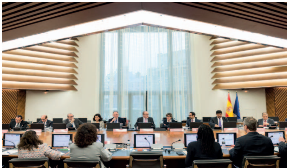
IV Foro de Información Financiera de Bancos Centrales de América Latina y el Caribe, celebrado en la sede central del Banco de España.

una jornada monográfica sobre fintech . Se organizaron otras actividades junto con el CEMLA, como el IV Foro de Información Financiera de Bancos Centrales de América Latina y el Caribe, la X Conferencia de Educación e Inclusión Financiera para América Latina y el Caribe, y la XVIII Reunión de Comunicación de Banca Central. Adicionalmente, el «Seminario sobre el euro y las reservas internacionales», el «Seminario sobre análisis de estados financieros y costes de bancos centrales», el «Seminario sobre banca central y gobernanza» y el «Seminario sobre riesgo operacional», todos ellos de carácter bienal, tuvieron su sede en el Banco de España. Como novedad, cabe destacar el «Seminario sobre medición de riesgo sistémico», coorganizado con el CEMLA y el BCE, y el primer encuentro «Fostering Women’s Leadership on Central Banking», organizado junto con el Bank Al-Maghrib, para tratar de identificar los retos y de conseguir políticas de igualdad de oportunidad entre sexos en niveles directivos dentro de los bancos centrales. Asimismo, en las otras modalidades de cooperación, se atendieron 33 visitas en el Banco de España y se realizaron 53 misiones en el extranjero, y se mantuvo un elevado nivel de cooperación a través de la atención de consultas recibidas.