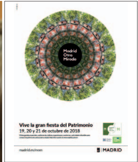
Taller educativo sobre billetes y monedas en euros celebrado en el Banco de España (izquierda). Visita patrimonial ofrecida en el programa de Madrid Otra Mirada (derecha).

pos de seguridad, y de centros educativos) sobre la comprobación de la legitimidad y la clasificación por estado de uso de los billetes.