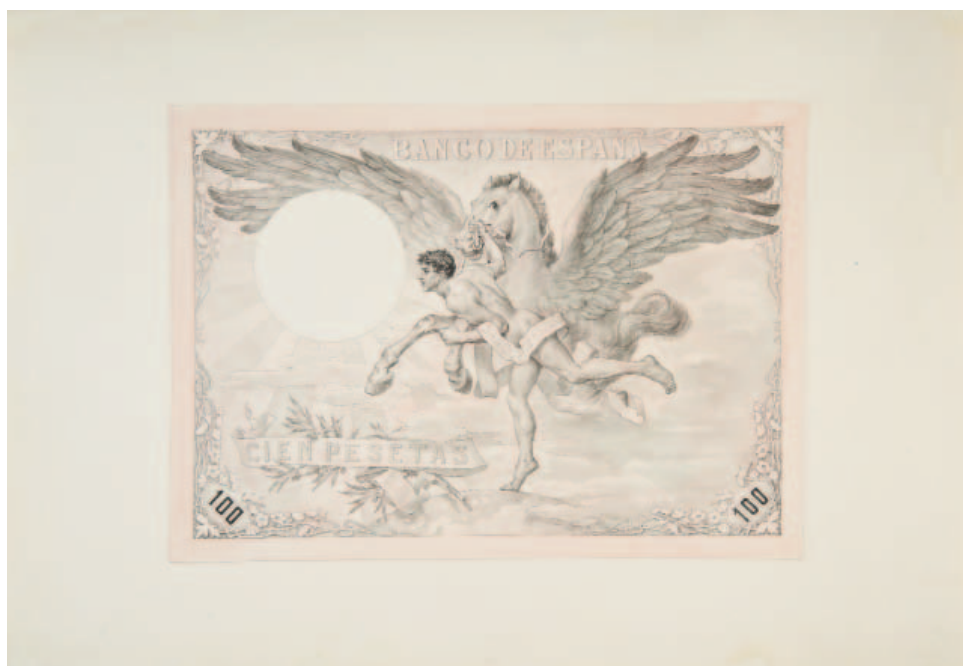
Pegaso (1903), de José Villegas Cordero, boceto para billete.

Una colección es un organismo vivo y, como tal, necesita nutrirse con nuevas incorporaciones que reflejen el arte de su tiempo y que la actualicen o completen. En ese sentido, siguiendo las recomendaciones de la circular interna de patrimonio histórico, se gestionó