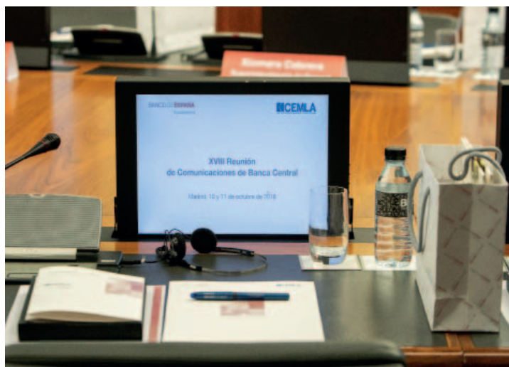
Seminario Internacional de Banca Central, en el marco de la cooperación del Banco de España con el CEMLA (izquierda). XVIII Reunión de Comunicación de Banca Central, celebrada en el Banco de España (derecha).