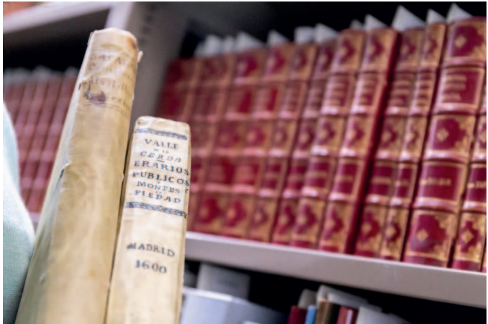
El Fondo de Especial Valor está formado por unos 16.000 ejemplares publicados entre los siglos XV y XIX.

El Archivo del Banco de España ha puesto a disposición sus fondos tanto para otros departamentos de la institución como para investigadores externos.