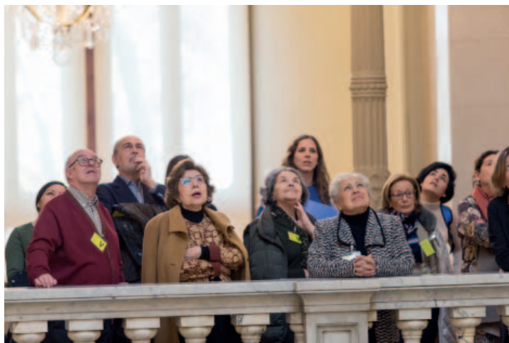
Grupo de visitantes observando las vidrieras de la Casa Mayer en la sede del Banco de España.

En 2017 se organizó, por vez primera, una competición entre centros educativos basada en los conocimientos financieros de sus alumnos. El concurso, abierto a los centros inscritos en el Programa Escolar de Educación Financiera del PEF y consistente en un juego de preguntas y respuestas sobre cuestiones financieras, tuvo varias fases eliminatorias: la primera, on-line , y las restantes, presenciales y celebradas en distintas sucursales del Banco de España, así como en la sede madrileña de la CNMV. La final tuvo lugar, dentro del acto central del Día de la Educación Financiera, en la sede en Madrid del Banco de España, resultando ganador el IES Al-Satt (de Algete, Madrid), al superar al IES Gustavo Adolfo Bécquer (de Sevilla). Cabe resaltar que el concurso resultó muy bien valorado por la comunidad educativa y está previsto repetirlo anualmente, ya que iniciativas de este tipo contribuyen a la promoción de la educación financiera entre los más jóvenes. Es preciso recordar que esta es precisamente una línea prioritaria del PEF, de acuerdo con la recomendación de la OCDE de que la educación financiera de la población debe comenzar a edades tempranas.