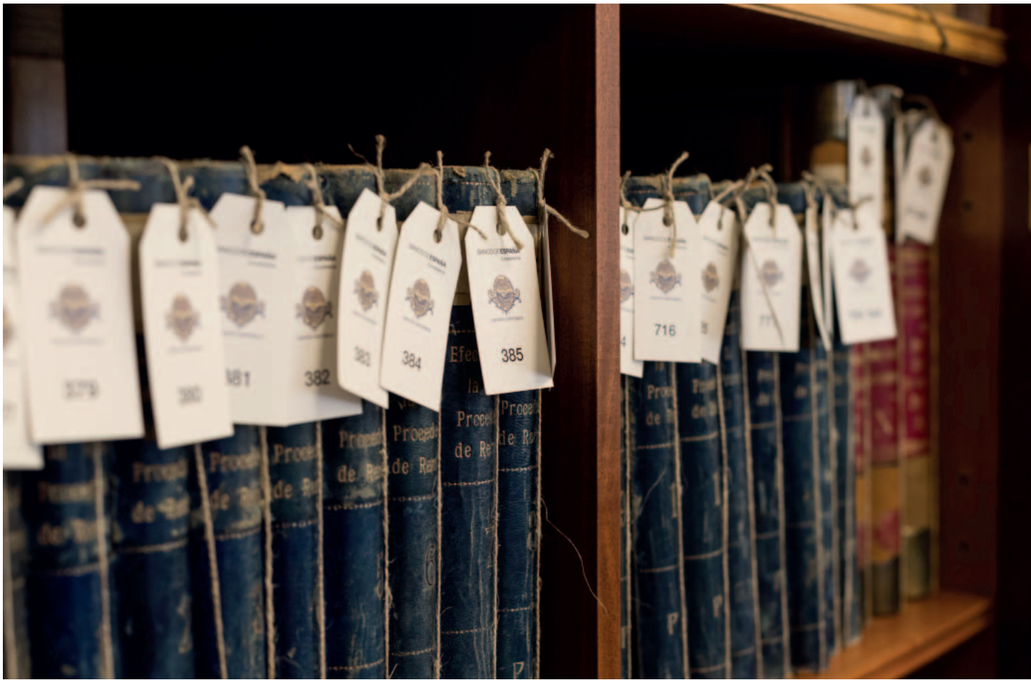
Descuentos de efectos procedentes de remesas, del Archivo Histórico del Banco de España. 1930.