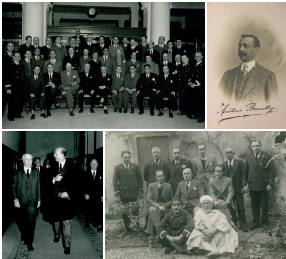
Arriba a la izquierda, empleados de la sucursal de Bilbao, año 1936. Arriba a la derecha, cobrador de la sucursal de Badajoz, año 1909. Abajo a la izquierda, visita de Humberto II de Saboya al Banco de España, acompañado por Joaquín Benjumea Burín, a finales de los años cincuenta. Abajo a la derecha, empleados de la agencia de Tánger, año 1936.

co de España y un incremento del conocimiento sobre nuestra propia historia. Está previsto que el proyecto continúe durante el 2018 con el tratamiento de 7.000 fotografías más.