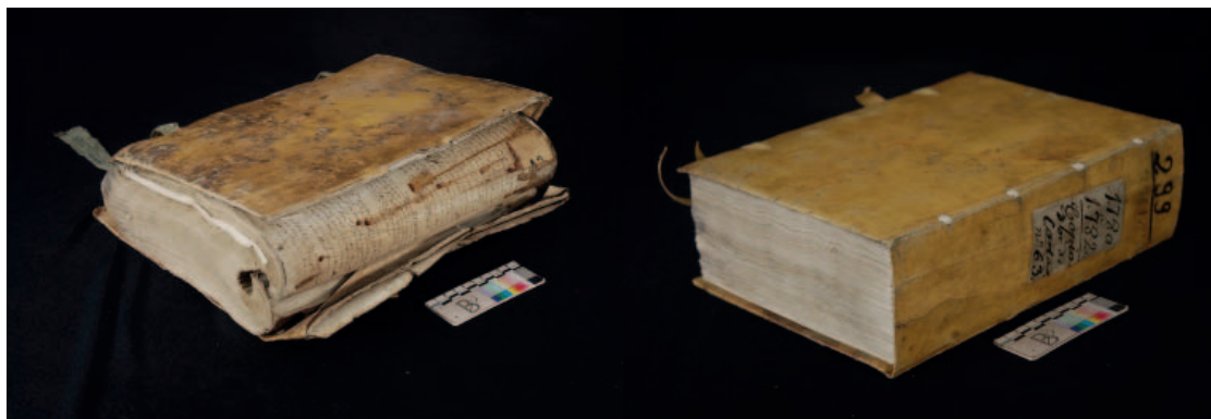
Proceso de restauración de un libro de archivo.

Proyecto de recuperación de los archivos históricos de la banca en España.