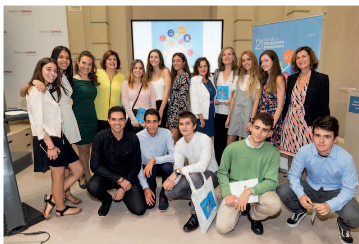
Jornada de educación de Finanzas para todos , con la asistencia de la secretaria de Estado de Economía, Industria y Competitividad, el gobernador del Banco de España, el secretario de Estado de Educación, Formación Profesional y Universidades, y el presidente de la CNMV (izquierda). Foto de grupo de los ganadores del Programa Escolar de Educación Financiera: IES Al-Satt, de Algete, Madrid (derecha).