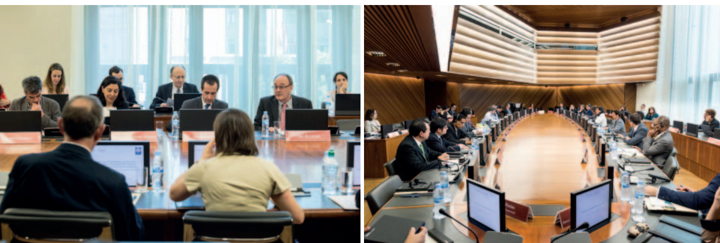
Conferencia del Banco de España en colaboración con el Banco Mundial: «El futuro de la globalización y la integración económica en Europa y América Latina: implicaciones para el crecimiento y la igualdad social» (izquierda). Primera reunión en la Sala Europa de expertos en Fintech (derecha).

Por lo que respecta a las actividades programadas de cooperación, en 2017 se organizaron 19 actividades entre seminarios, talleres, cursos y encuentros de expertos, 4 de los