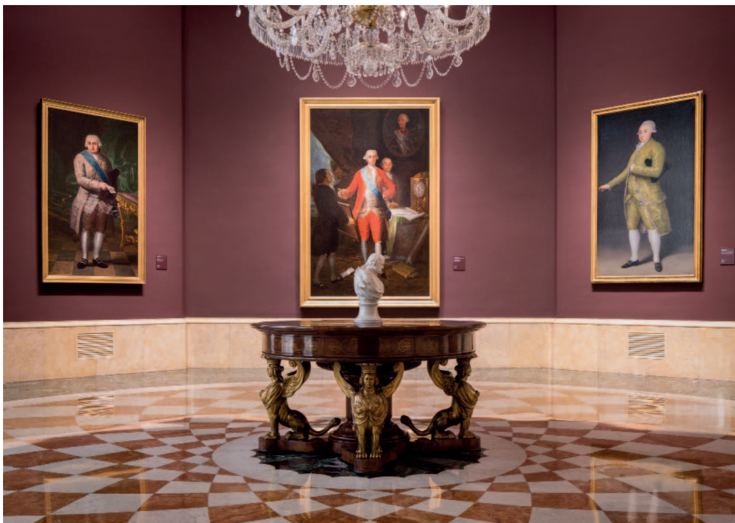
Sala Goya tras la revisión y actualización museográfica.

En el desarrollo de lo que es una de las primeras exigencias respecto de su colección artística, como es la de su conservación, el Banco de España puso en marcha, durante el ejercicio 2017, el Plan de Conservación Preventiva y Restauración, procediendo al análisis