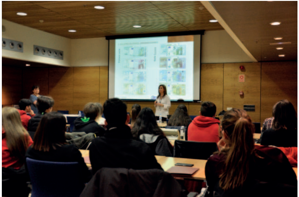
Taller escolar sobre falsificación de billetes realizado por el Departamento de Emisión y Caja.

En 2017 se organizó, por vez primera, una competición entre centros educativos basada en los conocimientos financieros de sus alumnos. El concurso, abierto a los centros inscritos en el Programa Escolar de Educación Financiera del PEF y consistente en un juego de preguntas y respuestas sobre cuestiones financieras, tuvo varias fases eliminatorias: la primera, on-line , y las restantes, presenciales y celebradas en distintas sucursales del Banco de España, así como en la sede madrileña de la CNMV. La final tuvo lugar, dentro del acto central del Día de la Educación Financiera, en la sede en Madrid del Banco de España, resultando ganador el IES Al-Satt (de Algete, Madrid), al superar al IES Gustavo Adolfo Bécquer (de Sevilla). Cabe resaltar que el concurso resultó muy bien valorado por la comunidad educativa y está previsto repetirlo anualmente, ya que iniciativas de este tipo contribuyen a la promoción de la educación financiera entre los más jóvenes. Es preciso recordar que esta es precisamente una línea prioritaria del PEF, de acuerdo con la recomendación de la OCDE de que la educación financiera de la población debe comenzar a edades tempranas.