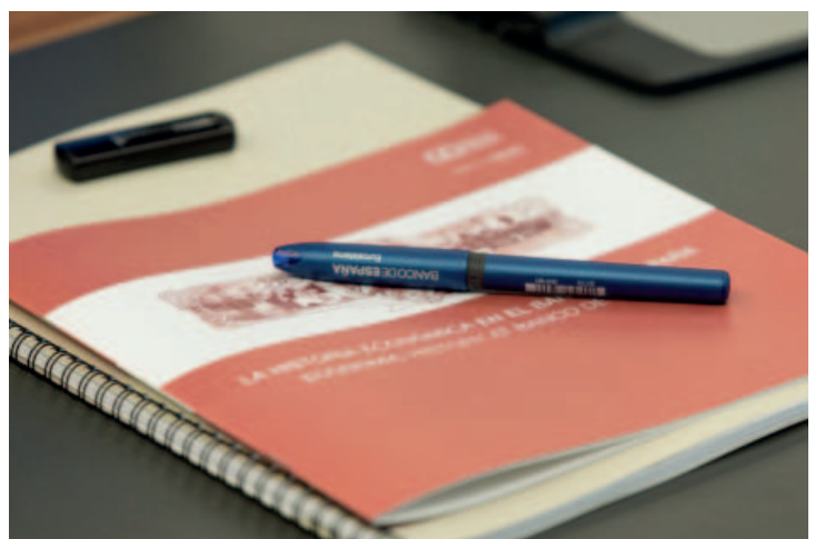
Intervención de Charles Goodhart, de la London School of Economics, en la III Jornada de Historia Económica (izquierda). Folleto «La historia económica en el Banco de España» (derecha).