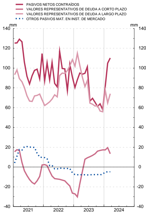
ESTADO. PASIVOS NETOS CONTRAÍDOS. POR SECTORES DE CONTRAPARTIDA Suma móvil de 12 meses