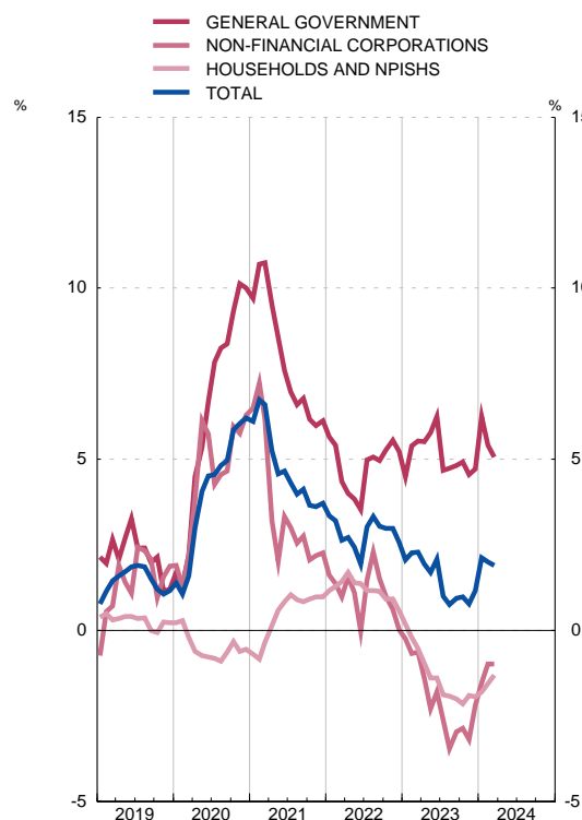
FINANCING OF NON-FINANCIAL SECTORS Annual percentage change