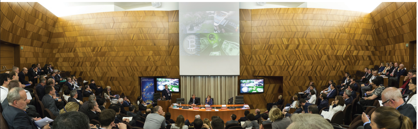
Seminario sobre el billete de 50 euros de la segunda serie de billetes, organizado por el Banco de España y el Banco Central Europeo para especialistas en el manejo de efectivo.

Por último, cabe destacar que, por primera vez, en el año 2016 el Banco de España se abasteció únicamente de billetes producidos por la sociedad IMBISA, medio propio del Banco que empezó su andadura a finales de 2015.