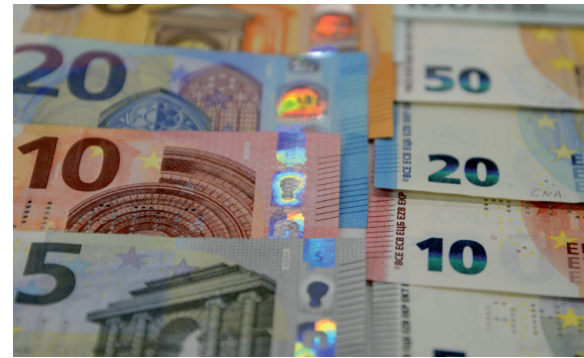
Billetes en euros de la serie Europa.

conocer a los profesionales del efectivo, comerciantes y público las características de los nuevos billetes de 50 euros de la serie Europa, que han empezado a circular en abril de 2017, así como para promover la adaptación de los dispositivos mecánicos de aceptación de billetes, a fin de que procesen los nuevos desde el primer día de su lanzamiento.