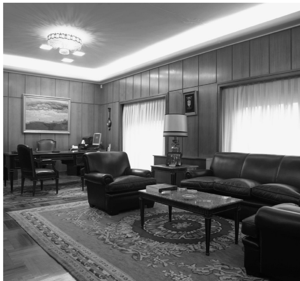
Despacho de dirección.